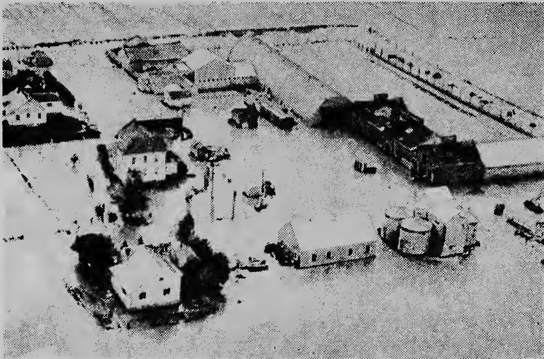
Awaserunan torrencial acompaña pa kibramentu di dam, a mata 28 persona na Montana mientras qu mas qu 100 otro persona a perde. Esaki ta un escena despues di e desastre na Sun River na Montana.

didanan economico di presion contra Sur Africa. Fedorenko, a critica paisnan occidental pa motibu di aumento di comercio cu e pais menciona. E delegado Britanico, sir. Patrick Dean a bisa, cu no tabatin elementonan notable, cu ta exigi tumamentu di medidanan di presion segun e convenio di Nacionnan Uni. E politica di apartheid segun e no ta forma ningun amenaza directo di paz y seguridad internacional.